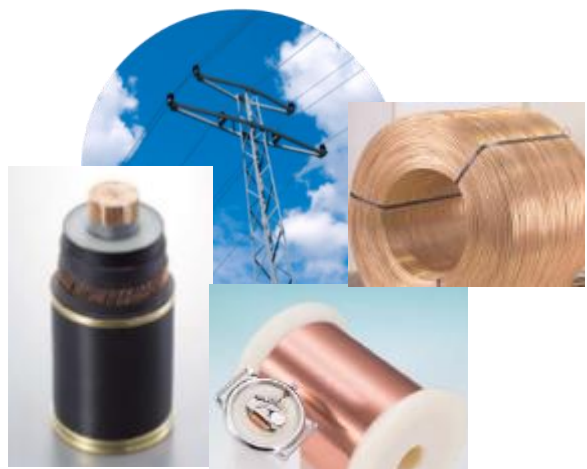
環境エネルギー部門 23.3%

連結売上高 3兆1,780億円 連結営業利益 1,663億円 連結従業員数 272,796人