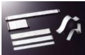
エレクトロニクス部門 7.0%