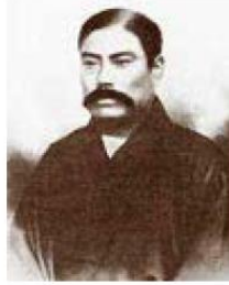
▲創業者 岩崎彌太郎