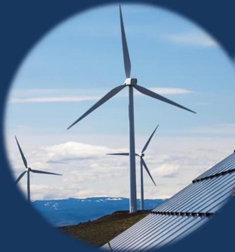
電力・エネルギー