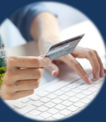
金融・公共・ヘルスケア