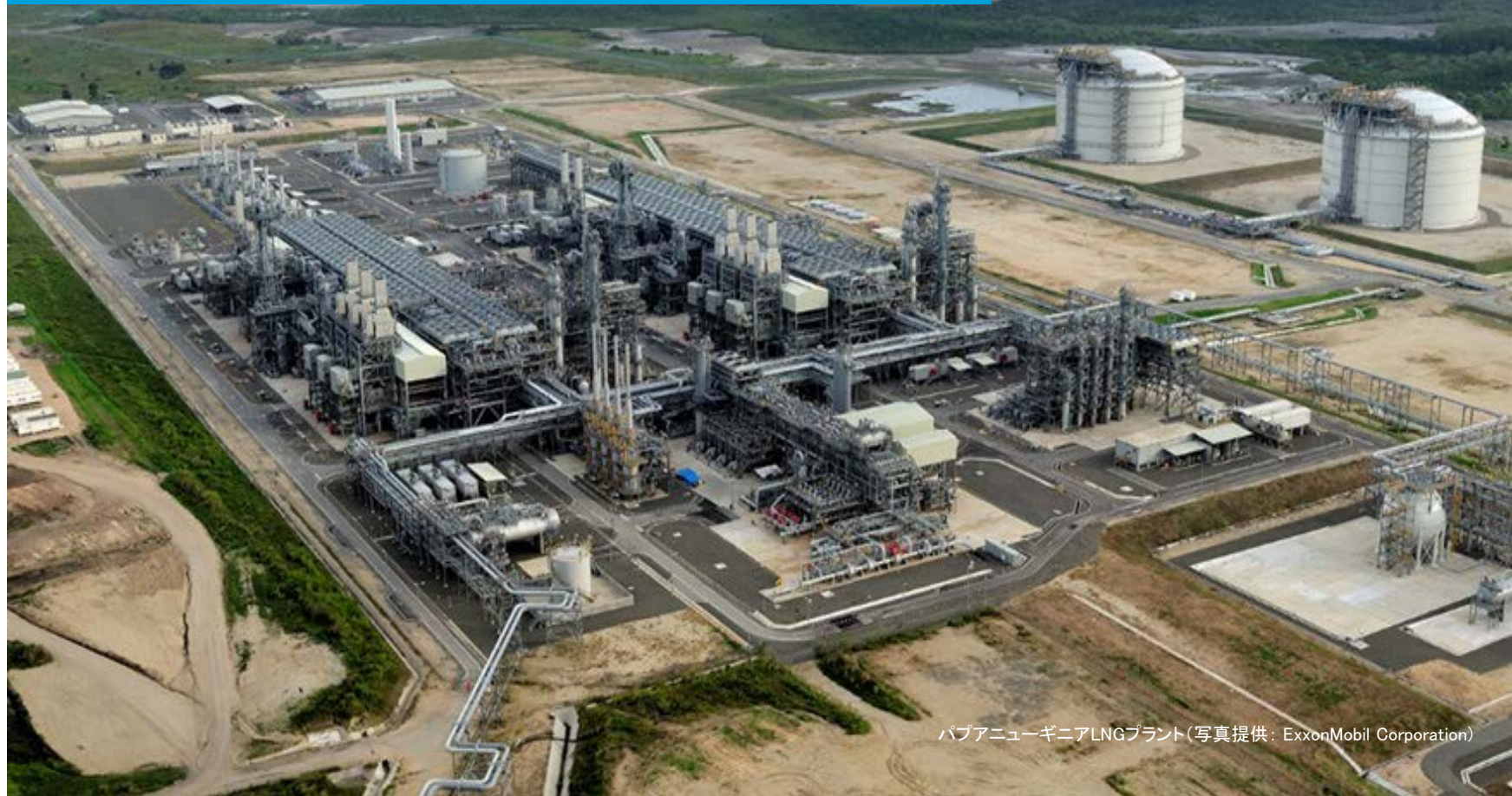
バブアニューギニアLNGプラント