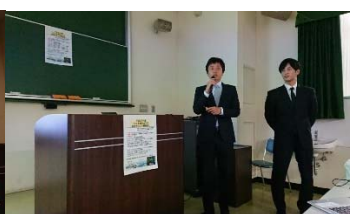
ショートプレゼン（前半）