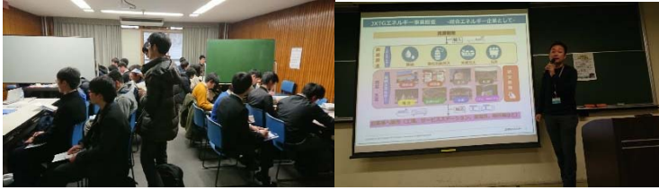
会議室での懇談（立ち見も） わざとラフな服装に着替えてプレゼン（後半）