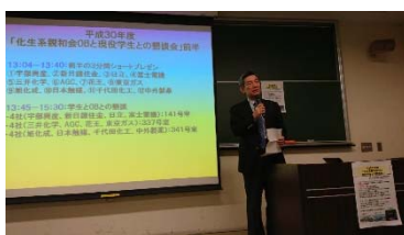
副会長開会挨拶@52号