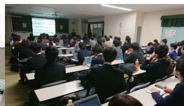
プレゼン中の52号会場